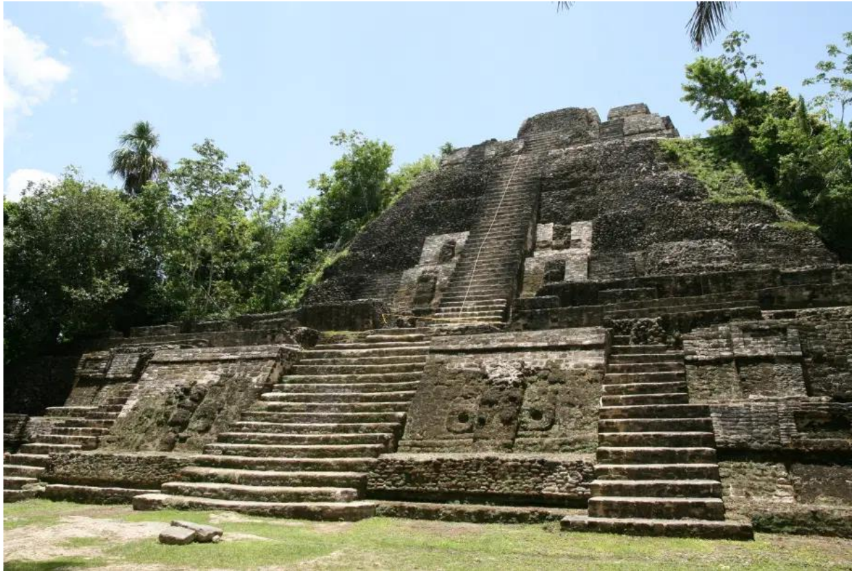
Templo Alto, Belize, América Central.

Em sítios arqueológicos incas, astecas e maias, é possível observar uma estrutura arquitetônica muito peculiar: uma espécie de base quadrangular que dava forma a uma pirâmide. No topo, se localizava uma plataforma em pedra, na qual sacrifícios eram realizados.